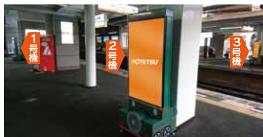
■ホームビジョン配置図