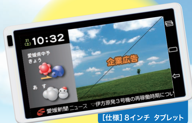
【仕様】8インチ タブレット