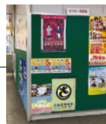
▲ 瓦町駅駅貼りポスター