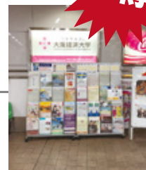
▲ 瓦町駅 パンフレットラック